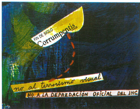
Detalle de "Crónicas Detestables"

They say you're temperamental? "Not so much, I think I'm normal, I simply feel a great passion for what I do, for what I believe: painting is my politics, my religion" Why did you stay away from the cusqueño painting circles? "I never liked circles of this nature, less so of the characteristics I found in Cusco, so closed a circle that it seems like a jail. The ideal atmosphere for chauvinist grand scale liars, folkloric, with more political interests... and not even that. It's the same with the institutions in charge of overseeing culture. It's assumed that they should create contemporary cultural move-