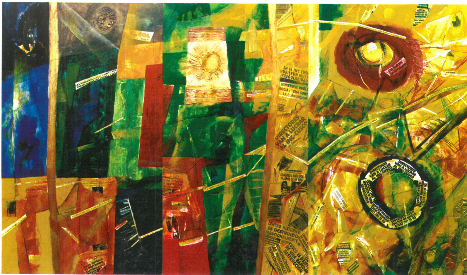
Triptico: "Periódico Amarillo". 2,72 x 1,58 cm. Técnica mixta

rico de la Av. Sol o esas espantosas ñustas de oro en la calle Plateros o esos "tigres" al ingreso del Palacio de Justicia u otros mamarrachos, como en la Plaza de Limacpampa, que parecen encantar al I.N.C.». ¿Qué harías tú, si fueras Director del I.N.C.? «Primero cambiaría totalmente al personal mediocre y coimero, separando a los que aún no están contaminados y tienen un verdadero interés por su trabajo. Impulsaría un movimiento invitando a personalidades de todos los campos culturales, incluyendo ambientalistas, quienes, mediante conferencias y exposiciones pedagógicas y cívicas, nos nutran, sensibilicen a las municipalidades, autoridades y a la población. Sobre todo al Poder Judicial, para tomar conciencia de dónde estamos y quiénes somos, para defender nuestro valioso legado, en vez de continuar acentuando, cada vez más, la parte folklórica y querer "matar" al que no lo hace, es decir, al que trata de desprenderse de esa argolla». Tu pintura, ¿Ha tenido varias etapas a lo largo de estos años? «Sí, como todo proceso, de la figuración a la abstracción, todo ha correspondido a mis circunstancias, como este "periódico amarillo"».♦