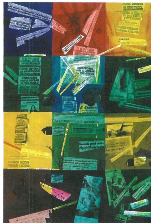
"Crónicas Detestables III". 1.20 x 83 cm

ting has had several stages in these years? "Yes, as all processes, from the figurative to the abstract, they have coincided with my circumstances, such as the "yellow newspaper". •