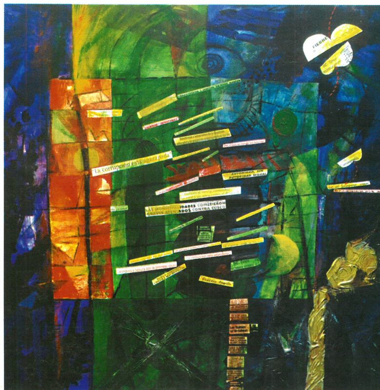
"Crónicas Detestables I". 1.20 x 1.20 cm

ting has had several stages in these years? "Yes, as all processes, from the figurative to the abstract, they have coincided with my circumstances, such as the "yellow newspaper". •